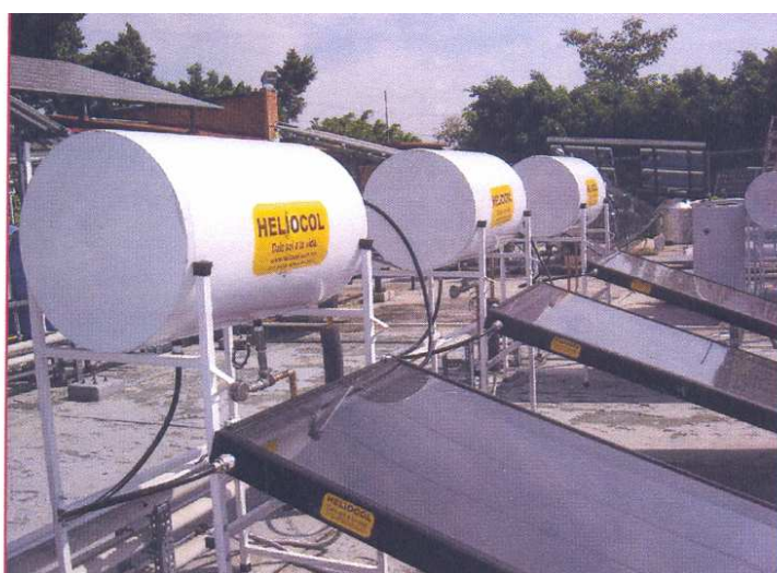
Imagen del producto ensayado en el laboratorio