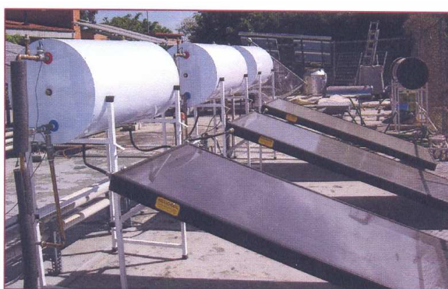
Imagen del producto ensayado en el laboratorio